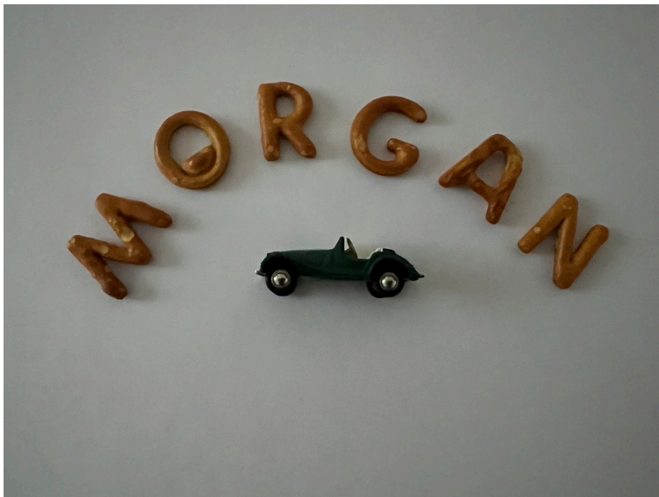
Eine kleine Knabberei

Gerne könnt ihr mir auch Bilder zukommen lassen, die dann in den News veröffentlicht werden. Ich freue mich über Euer mitwirken.