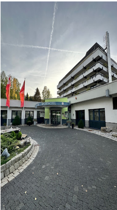
Restaurant Sporthotel Am Tannenkopf 1 35305 Grünberg

Dies wiederum kann ich während unseres Zwischenstopps auf dem Hoherodskopf dem Restaurant telefonisch durchgeben.