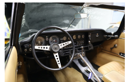
Claus neue Baustelle!